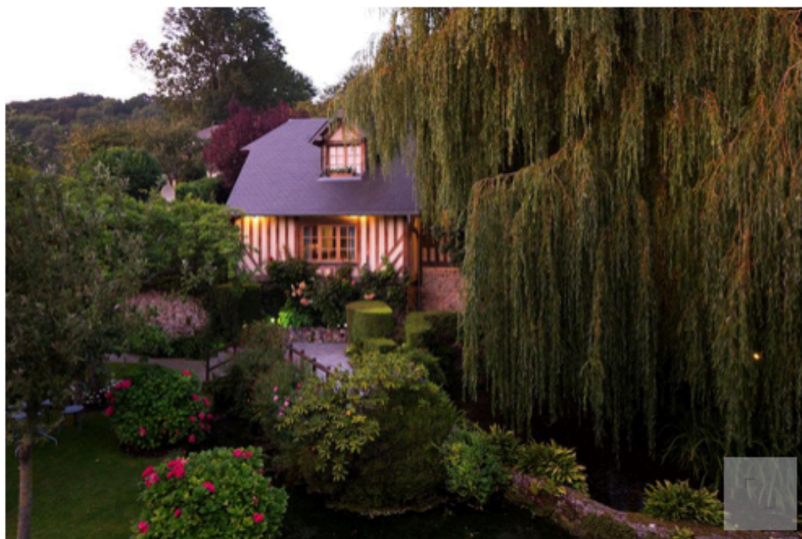
La Ferme Saint-Siméon, retraite idéale dans la campagne normande.

À 10 minutes du port de Honfleur, c'est en lisière de forêt que les initiés investissent l'adresse bis de La Ferme Saint-Siméon : une chaumière de 15 chambres au charme rustique. Une retraite idéale dans la campagne normande, pour s'isoler des spots touristiques sans renoncer au charme des villages typiques du pays d'Auge.